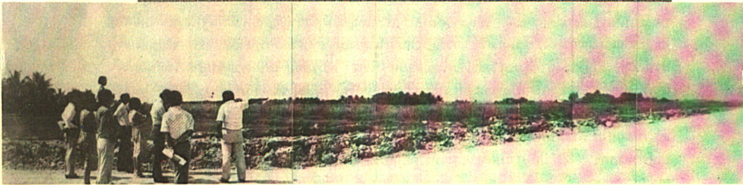
คณะผู้บริหารมหาวิทยาลัย ชมที่ดินและวางแผนการก่อสร้างที่ทำการ

๕. สำนักทะเบียนและวัดผล แบ่งส่วนเป็น สำนักงานเลขานุการ ฝ่ายรับนักศึกษา ฝ่ายทะเบียนนักศึกษา ฝ่ายวัดผลการศึกษา ศูนย์วิจัยและพัฒนาแบบทดสอบ และศูนย์คอมพิวเตอร์ ซึ่งกำลังแยกออกมาจัดตั้งเป็นสำนักคอมพิวเตอร์