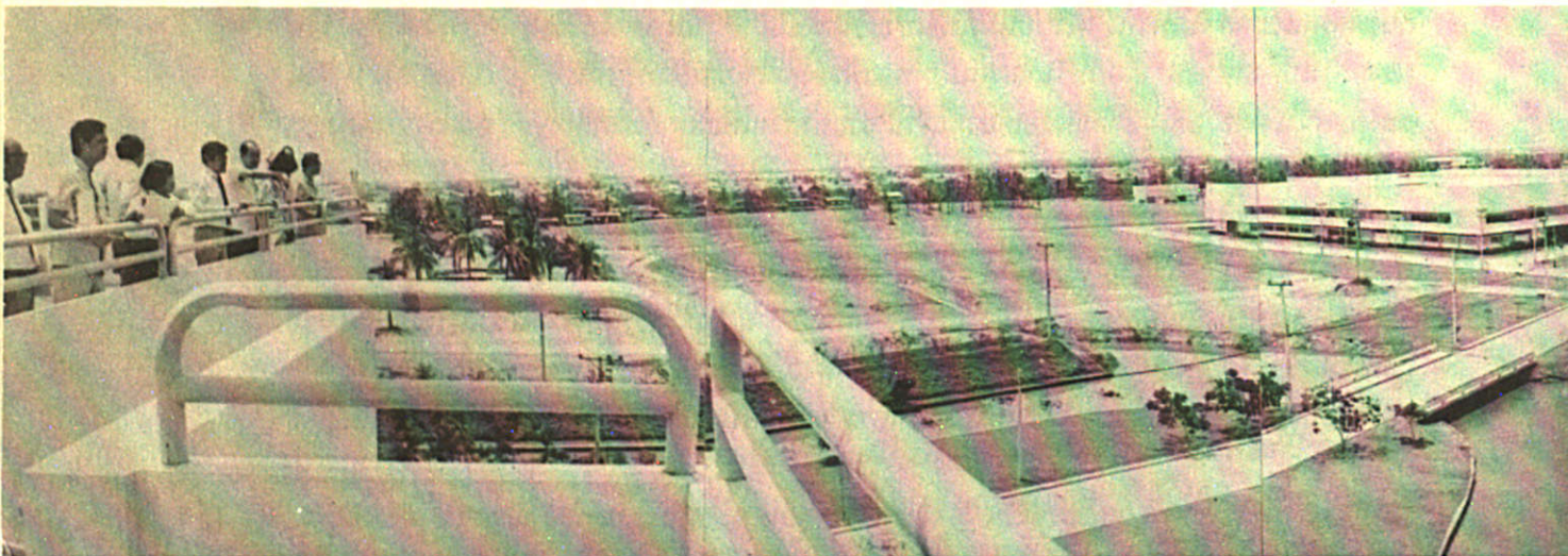
ที่ทำการมหาวิทยาลัย ขณะทำการก่อสร้างอาคารกลุ่มที่ ๓

ลักษณะโครงสร้างของการจัดส่วนราชการของ มสธ. นั้น มีลักษณะพิเศษกว่ามหาวิทยาลัยปิด คือการจัดให้มีสภาวิชาการขึ้นดูแลงานด้านวิชาการของมหาวิทยาลัยเป็นการเฉพาะ เพื่อให้สามารถควบคุมดูแลและรักษามาตรฐานทางวิชาการร่วมกับสาขาวิชา แยกออกมาจากสภามหาวิทยาลัยซึ่งมีอำนาจหน้าที่ทางด้านนโยบายและการบริหารมากกว่าด้านวิชาการ จึงเป็นมหาวิทยาลัยเดียวที่มีสภาวิชาการ นับได้ว่ามหาวิทยาลัยสุโขทัยธรรมราชา ได้มีโอกาสจัดส่วนงานที่สอดคล้องและเอื้ออำนวยต่อระบบและวิธีการจัดการศึกษาในระบบเปิด ทำให้มีความคล่องตัวและมีประสิทธิภาพในการดำเนินงานสูง สามารถประสานสัมพันธ์ และผนึกกำลังกันปฏิบัติงานได้ดีโดยเฉพาะการทำงานเป็นทีม